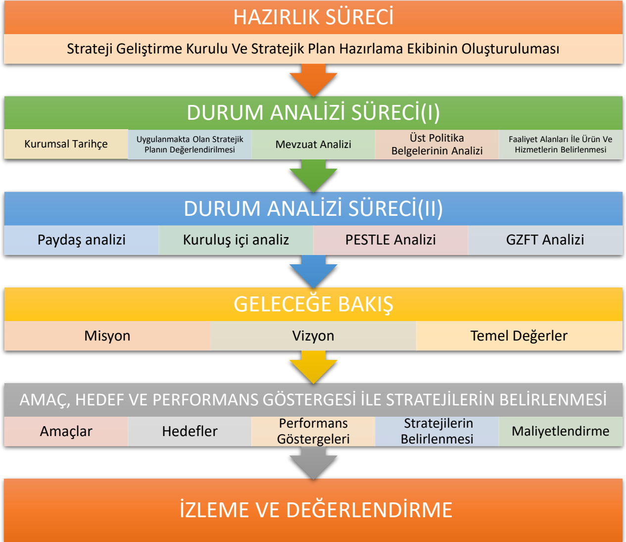
Şekil 1. Adil Karaağaç M.T.A.L 2024-2028 Stratejik Plan Hazırlama Modeli

Durum analizinin ardından geleceğe yönelim bölümüne geçilerek okulumuzun amaç, hedef, gösterge ve eylemleri belirlenmiştir. Çalışmaları yürüten ekip ve kurul bilgileri altta verilmiştir.